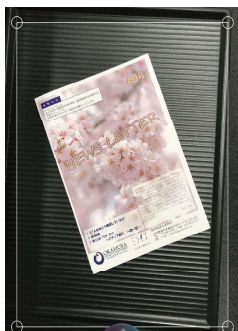
メモアプリの「書類をスキャン」で撮影する！