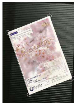
歪んで撮影してしまっても四隅の補正が可能！