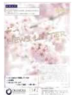
形が整ったら PDF で保存！