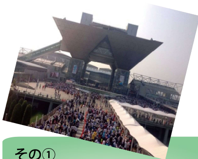
その① 会場のビッグサイト (みんなグッズを求めています！)

今年も夏休みには恒例のコミケへ1人で行きます。 (最近では現地で合流する友人ができました！)