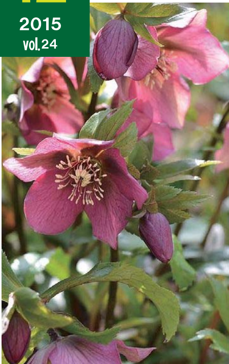
クリスマスローズ